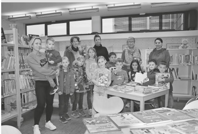
Interessierte Kinder bei der Bücherpräsentation für Leseanfänger in der Gemeindebücherei am 6. November.