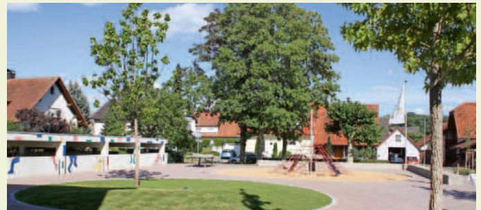
Ein kleiner Teil des sanierten Schulhofes Ost mit dem neuen Kletternetz