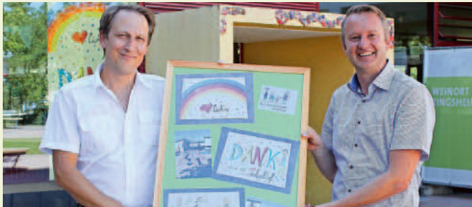
Schüler und Lehrpersonal dankten zur Fertigstellung des Schulhofes mit einer kunstvollen Collage