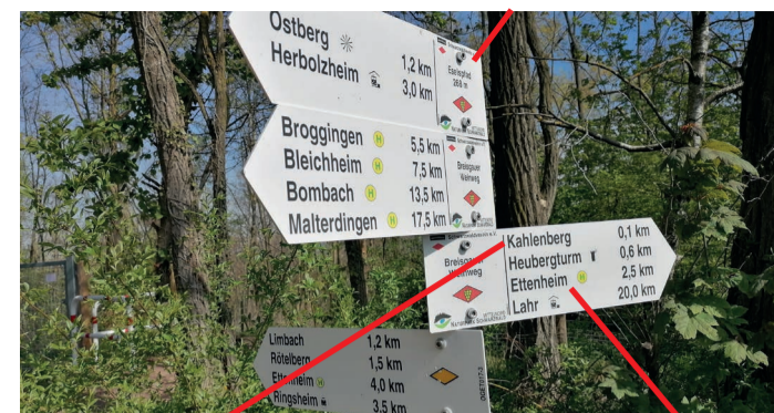
Nächster Wegweiser in dieser Richtung: Kahlenberg 0,1 km Markierung gelbe Raute

Standortfeld mit Angaben zu: Standortname Höhe Art der Markierung